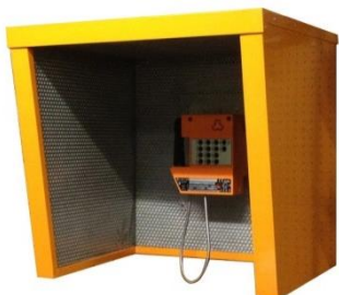
Caseta Ac stica De 25 dB