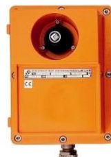
Repetidor ATEX KLM214