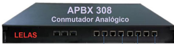
Central Telef nica ATEX TCT376E1L6

Compatible con Cualquier Central de Telefon a Anal gica o Digital