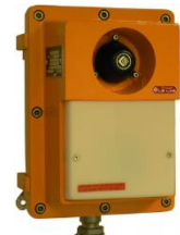
Repetidor y Flash ATEX SVG 214 A6CA