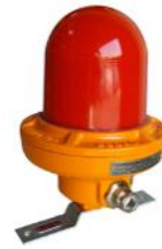
Luz Flash ATEX FEF232